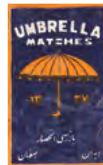
لیبل دیگری از کبریت‌سازی اصفهان