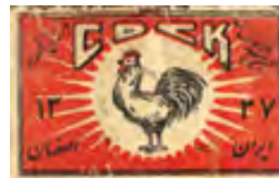
لیبل کبریت‌سازی اصفهان