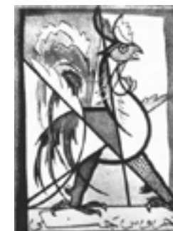
نشان نشریه خروس جنگی