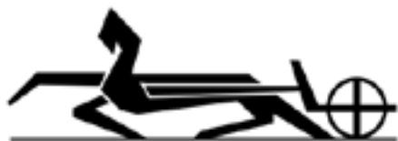
آرم اولیه ایران ناسیونا (ماشین پیکان) که توسط جمشید اخگر طراحی شد (سال ۱۳۳۶)