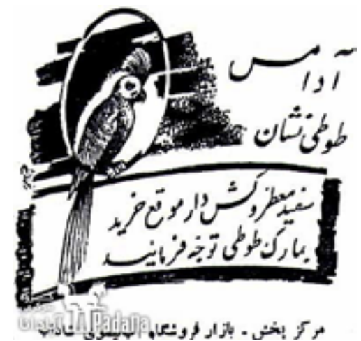
نمونه‌ای از تبلیغات آدامس طوطی نشان