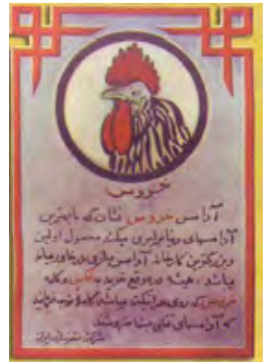
دو نمونه از تبلیغات آدامس خروس